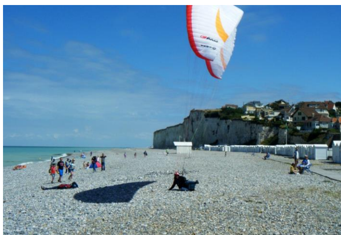
Cricri à Criel : tu t'es vue quand t'as pas bu ???!!!

Pensez à utiliser notre forum ! http://www.paralaile62.fr/phpBB/