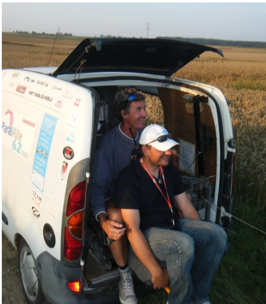
Le treuil école avec double commandes de frein : une réalisation Jeff pour Jeff !