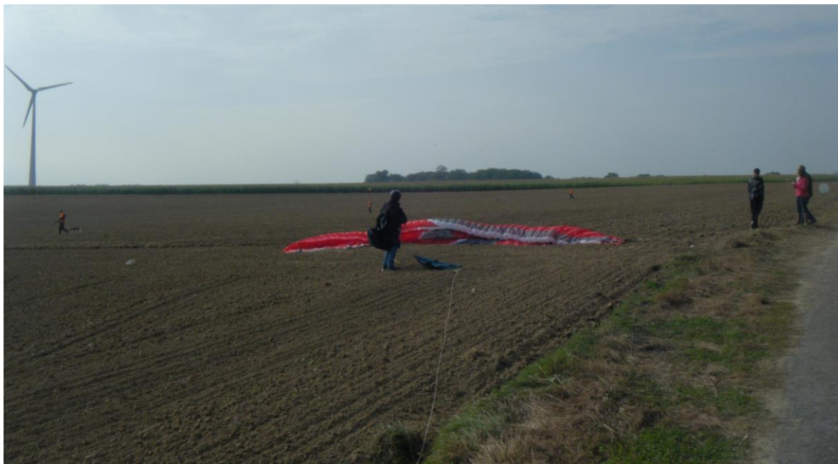
En fond, les chasseurs, les fusils, les chiens, prêts à tirer sur le Ch'Guypaète