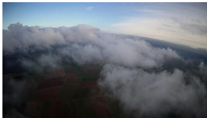
Octobre dernier à Campagne