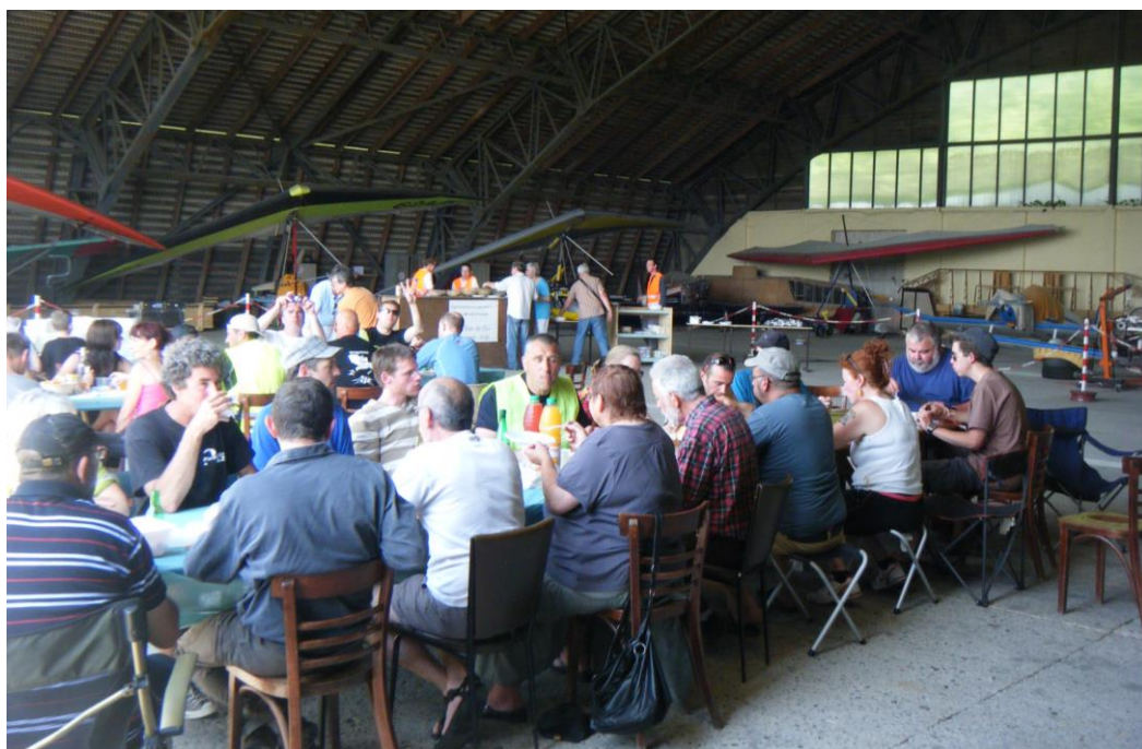
Inter-treuil les 6 et 7 juillet sur l'aérodrome de Saint-Omer : une foule de gueux parapentistes issue des zones sinistrées du nord de la France a quitté ses corons et ses terrils pour se ruer sur les Restos de Paral'Aile 62