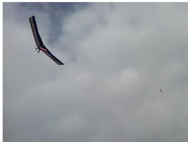
Non, 2 delta !!! et sur cette photo j'ai la preuve que Michel vols plus haut que Alain.