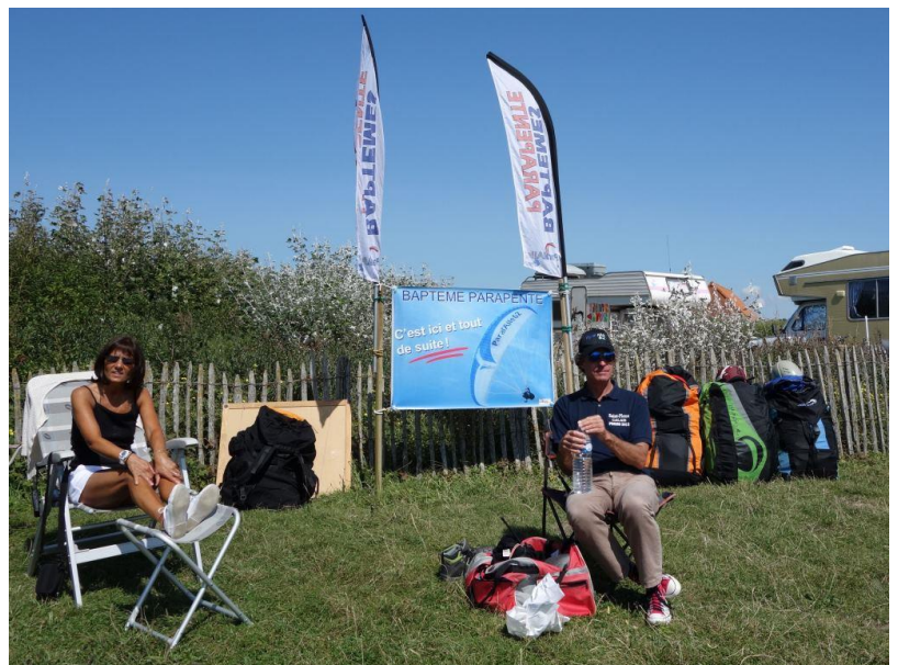
Espace accueil biplaces. Le président attend le client.

http://vimeopro.com/camacro/voler-avec-les-rapaces-ou-le-partage-du-ciel