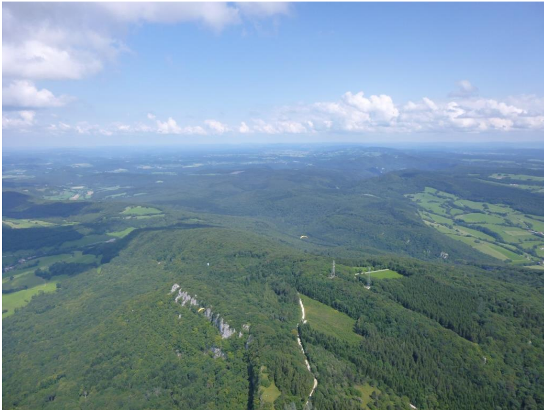
Plafond à 1500m , soit 620 m de gain vs déco