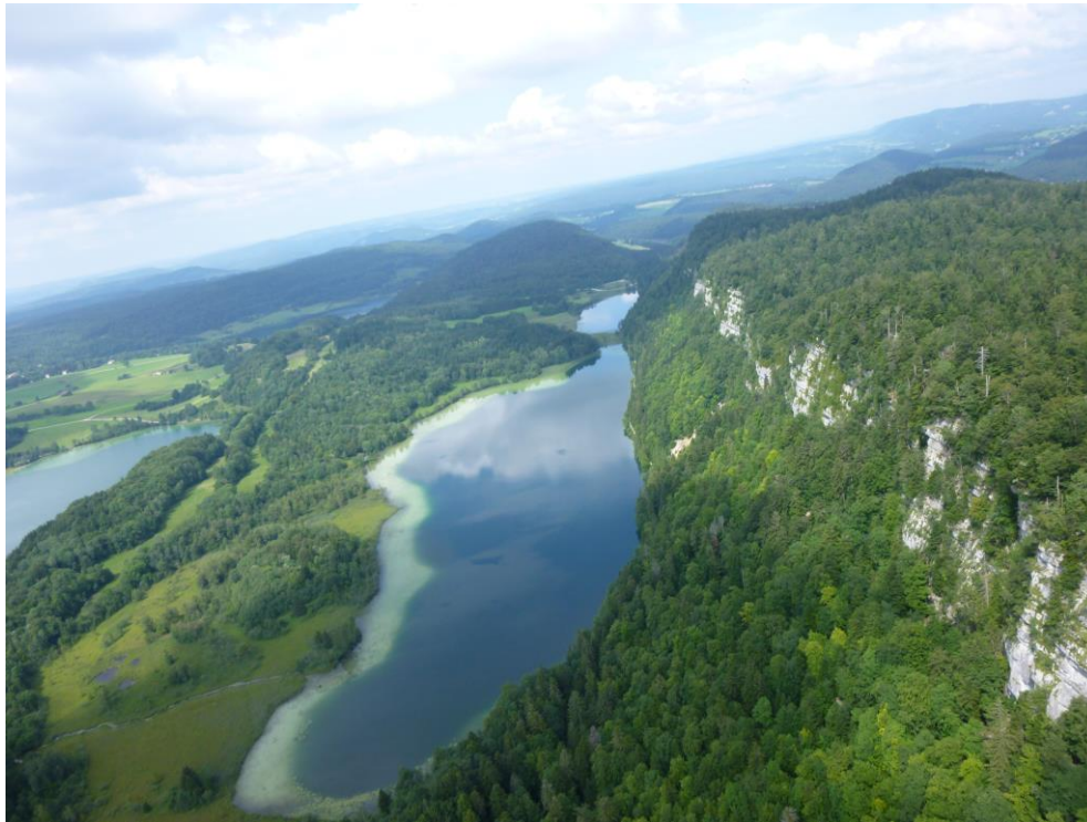
On y vole au-dessus de 4 lacs