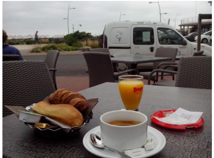
Le réconfort après un vol très matinal à Criel. des choses si simple mais si agréable.