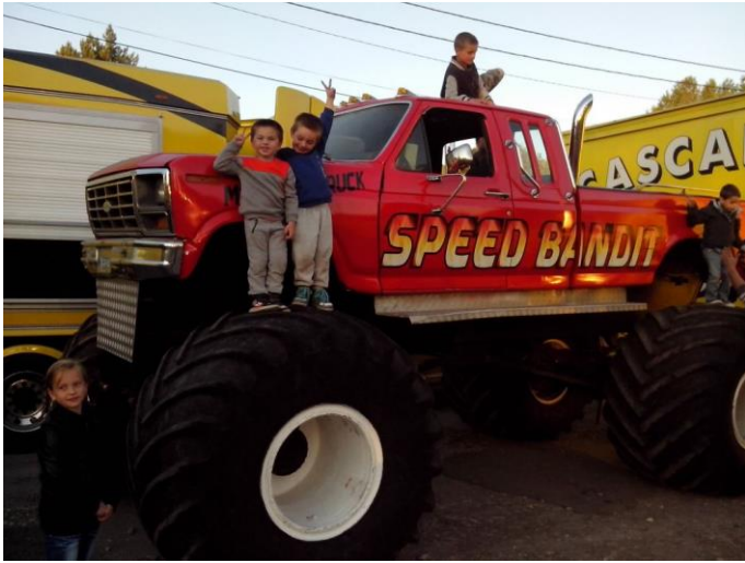
Mes fils sur le pneu valident le futur pick-up pour le treuil. avec ça on peut treuiller ou on veut.