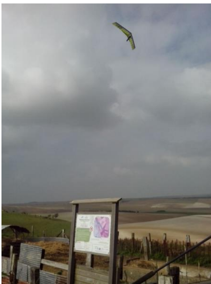
What it ??? Un delta à Frencq