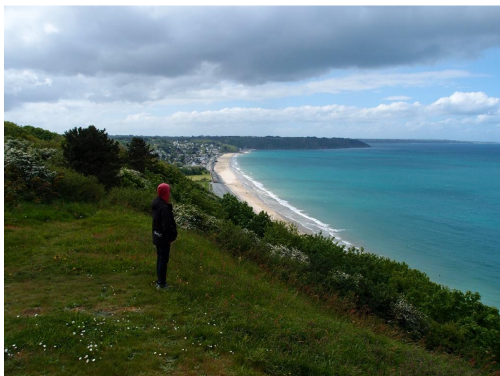
Déco des Tablettes