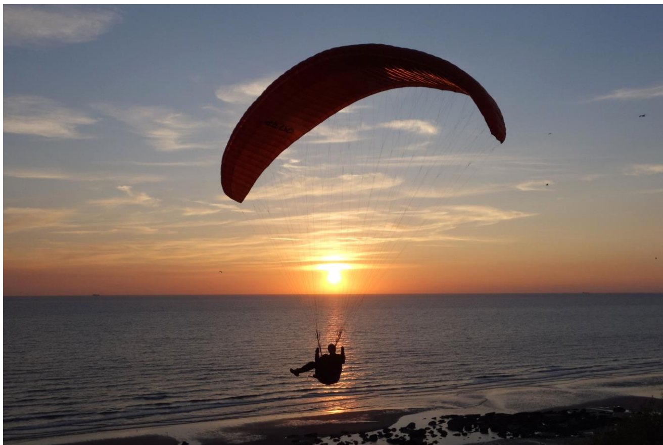
Vol au coucher du soleil à Equihen le 4 août 2014