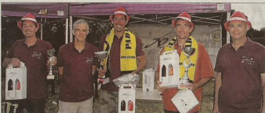
■ Les organisateurs et les trois premiers pilotes réunis après la remise des prix.

Plusieurs vols de découverte en biplace ont pu être réalisés par les biplaceurs bénévoles du club qui ont fait de cette épreuve amicale une réussite. Ce n'est pas une compétition au sens propre du terme. Elle est le temps fort de la vie du club avec sa convivialité et son caractère plus ludique que compétitif. C'est aussi la fête du club. Son but n'est pas de faire des champions du vol libre, mais de permettre à tous les pilotes de pou-