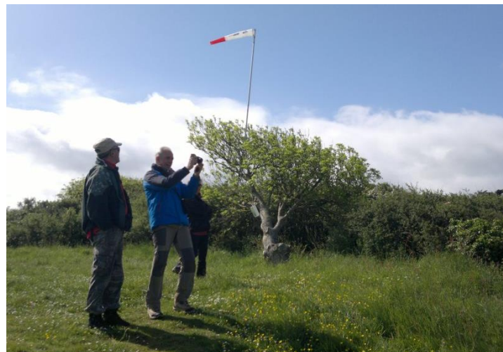
Saint Pabu toujours