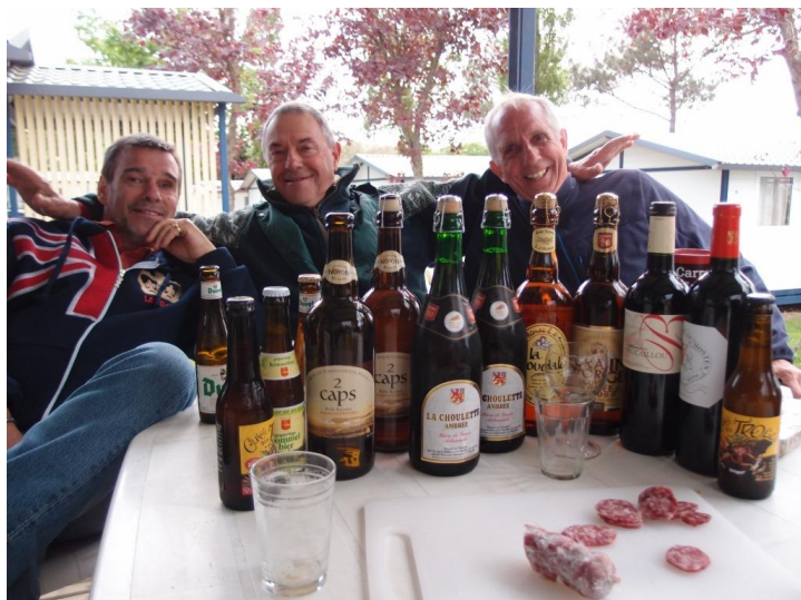
... saints pas bu encore