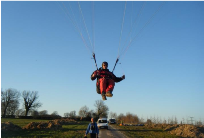
Notre Lolo a le chic d'immortaliser des moments forts. Mon retour après avoir engagé mes premiers 360. J'ai la banane.