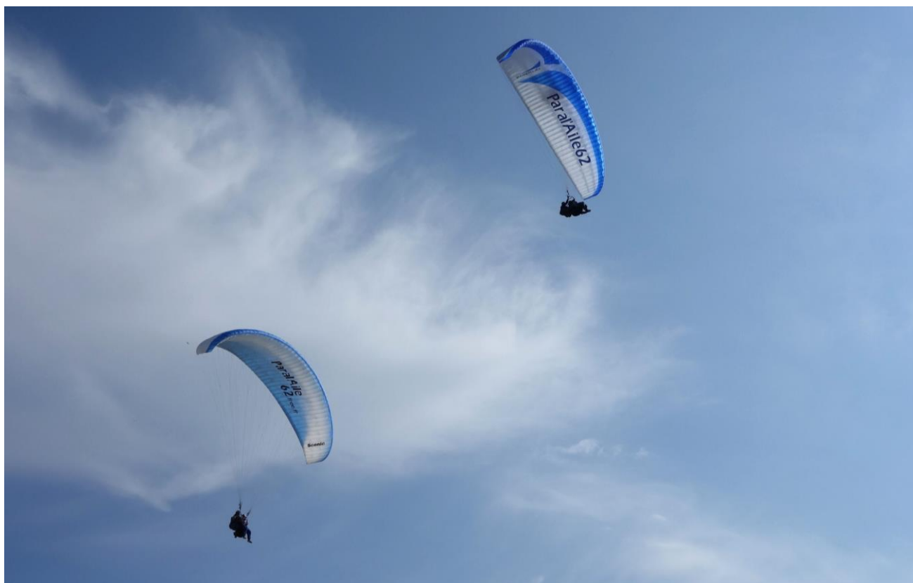
Bi vol de biplaces Paral'Aile 62, le 4 août à Equihen