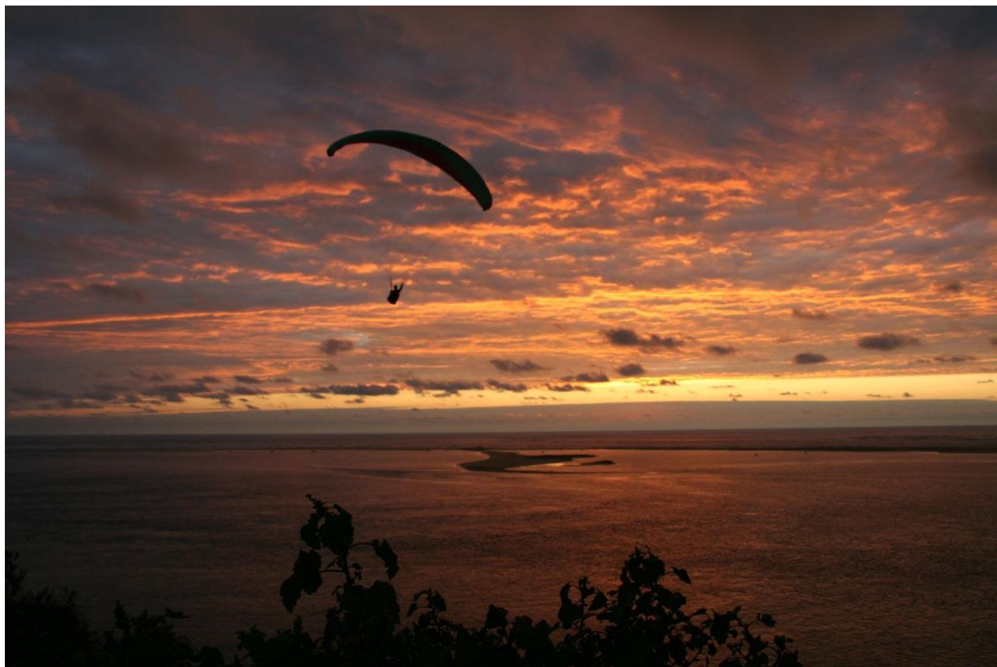
Coucher de soleil sur le banc d'Arguin