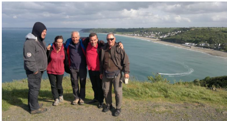
Au décollage de Tournemine

Nous n'avons pas beaucoup volé, mais nous avons passé un agréable week-end ! Un grand merci à Didier pour l'organisation de ce séjour et pour nous avoir fait découvrir les sites de la baie de Saint-Brieuc. On reviendra !