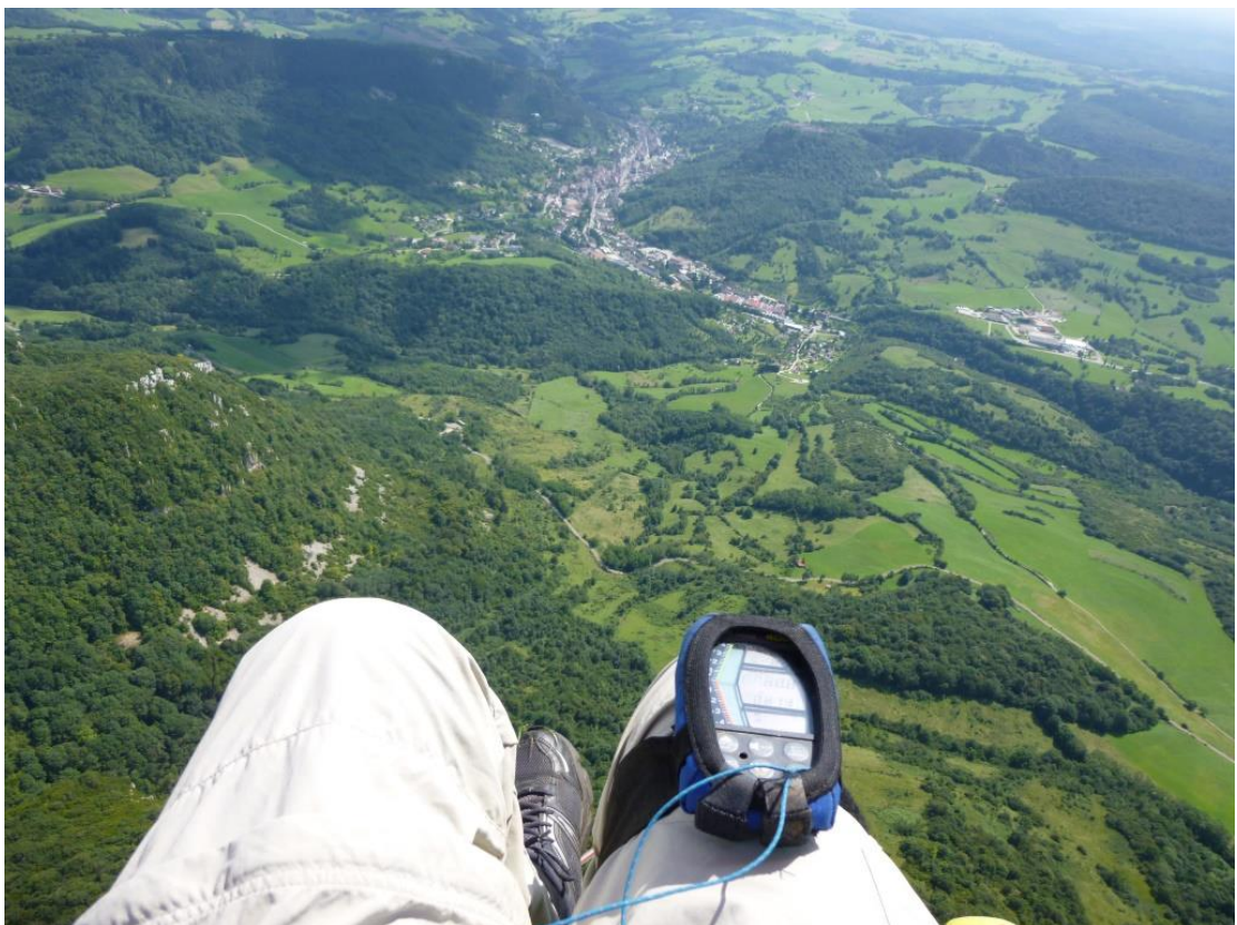
Arrivée sur Salins les Bains avec 950 m de gaz