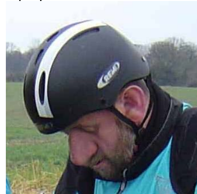
photo non truquée (ou presque...)