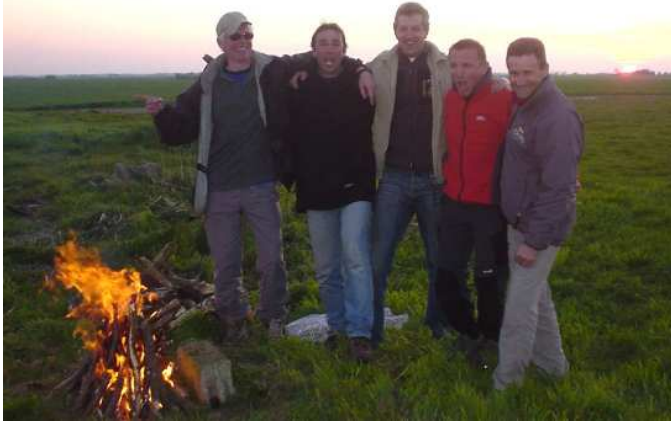
L'union des clubs fait la force !