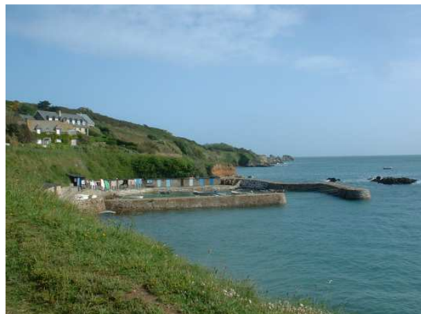
Le plus petit port du monde, juste avant la baie d'Ecalgrain, à 25 minutes à l'ouest de Cherbourg