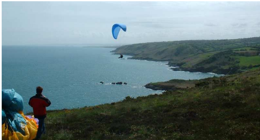
A 15 minutes de Cherbourg, site en orientation est nord-est