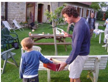
Le tirage au sort pour gagner des T-shirt aux couleurs du club