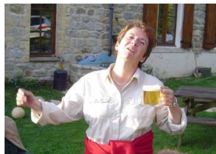
Notre doyenne fête son demi-siècle