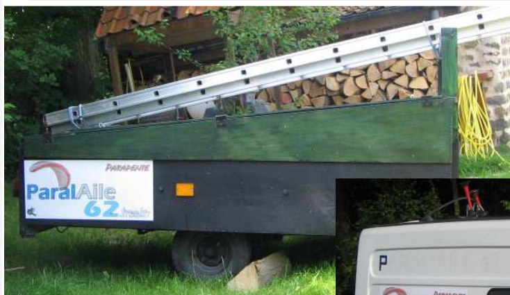
Nouvelle décoration pour la remorque et le treuil