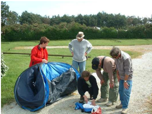
Camping du Hable à Omonville-la-Rogue