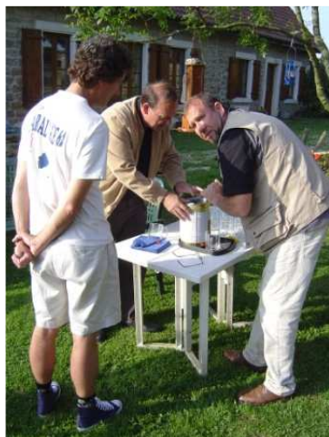
Le seul thermique de la journée, la pompe... à bière