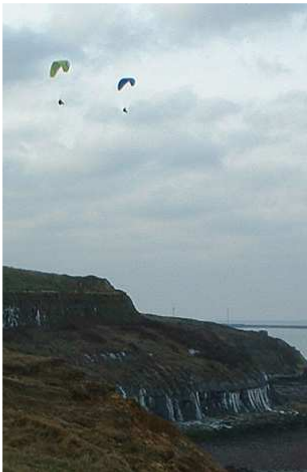
Vol au-dessus du glacier de La Crèche, janvier 2009

ans qui pratiquait du parapente sur les hauteurs d'Équihen-Plage a chuté lundi vers 11 heures. Il s'est élançé des hauteurs de la falaise, à proximité de la station d'épuration et devait normalement atterrir sur la plage en contrebas. Pour atteindre cette zone difficile d'accès, les pompiers ont dû rejoindre le blessé en 4X4 en longeant la plage. L'homme, victime d'une fracture du pied, a été transporté par les pompiers et le SMUR à l'hôpital de Boulogne-sur-Mer.