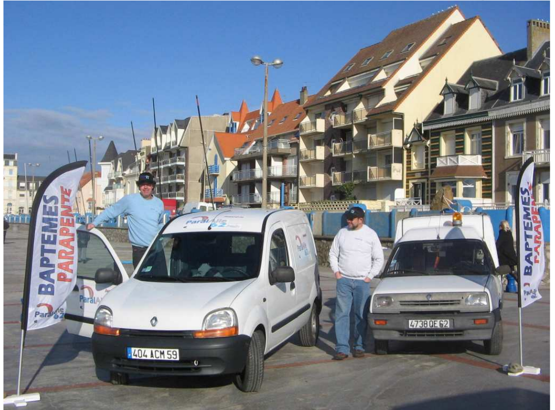
Le nouveau véhicule treuil au côté de son ancêtre... rendez-vous page 7