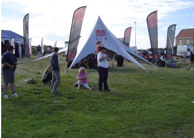
Le stand Gin