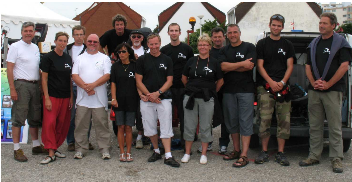
Les tee-shirts nano-technologiques avec micro-fibres à l'origine du virus du parapente sensés protéger de la Blériot mania ! (stock épuisé !)

Une partie des visiteurs encore sains a été isolée et pris en charge dans notre stand par notre personnel soignant. Il s'agissait préventivement d'inoculer le virus du parapente par un procédé testé pour la première fois et dont nous ne maîtrisons pas encore tous les effets secondaires... (selon une source interne que nous ne pouvons pas citer, la FFVL en aurait commandé 8000 exemplaires en Chine mais fabriqués au Cambodge, au tarif imbattable de 5000 dollars pièce HT et devant être stockés à Saint-Hilaire...).