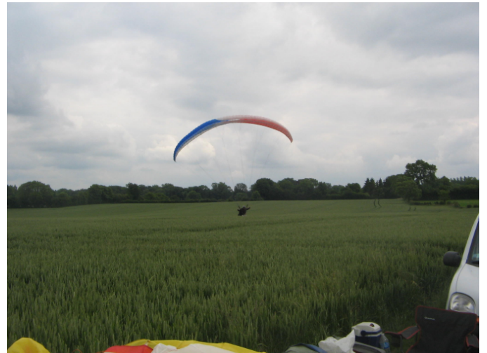
Oups... atterro loupé ! Qui est donc le pilote de cette voile bleue - blanc - rouge ? Serait-ce sa voile professionnelle... ?