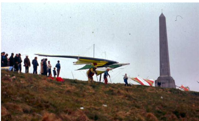
La belle époque