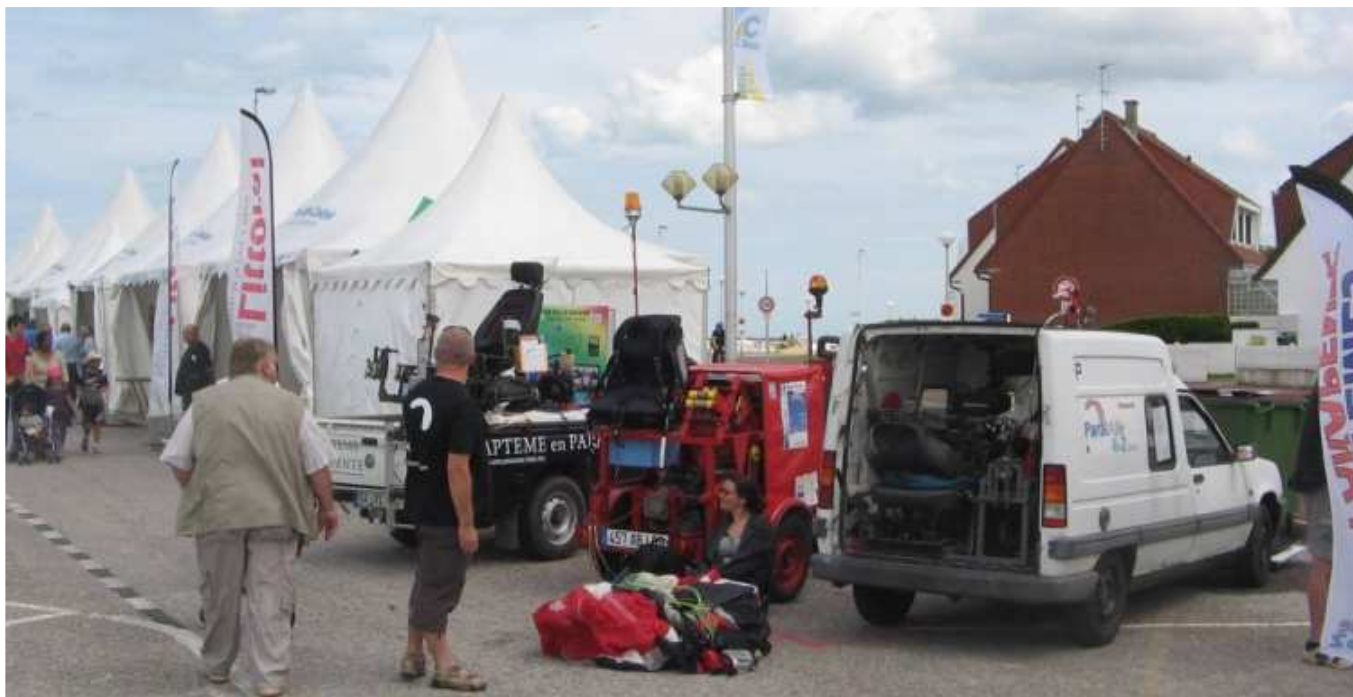
Nos 3 vaporisateurs bruyants (treuils) sensés effrayer le Blérius sont cloués au sol, eux-mêmes victimes du virus !

D'intrépides parapentistes chetemis (les clubs Fil d'Ariane, Raz'Motte et Paral'Aile 62) n'ont pas hésité à braver la Blériomania (quoique immunisés par leurs nouveaux tee-shirts équipés de nano-technologie avec micro-fibres tueuses du Blérius à l'origine de la Blériomania... encore une invention de Mathieu !) équipés de 3 vaporisateurs géants et bruyants sensés détourner le public des Blériot. Hélas, le Blérius est très résistant et a même contre-attaqué grâce à ses cellules non encore identifiées, il nous a jeté un mauvais sort sous forme d'un vent beaucoup trop fort pour voler au treuil.