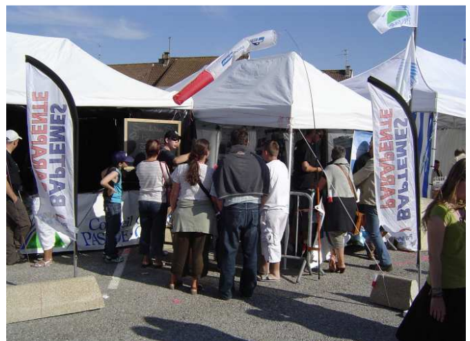
... Blériot 2009... on s'est amélioré non ?