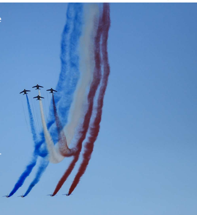
La Patrouille de France lors de Blériot 2009, toujours aussi impressionnante