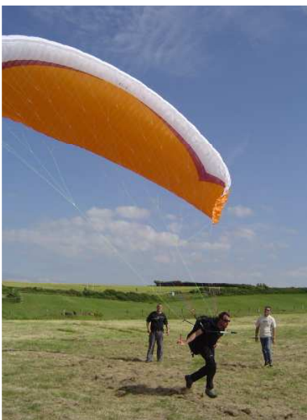
Essai de la Gin Rebel, décollage au treuil ... manuel !