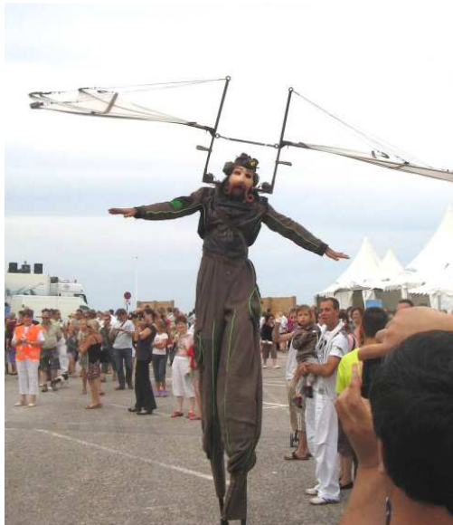
Le Blériot très haut