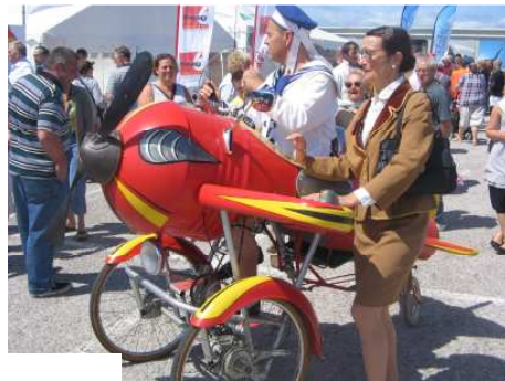
Le Blériot rigolo !