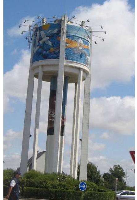
Le Blériot château d'eau