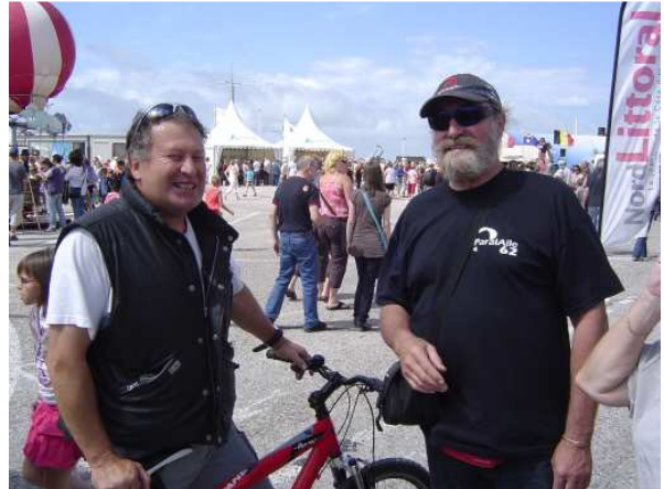
... les mêmes dans le désordre et en couleurs !