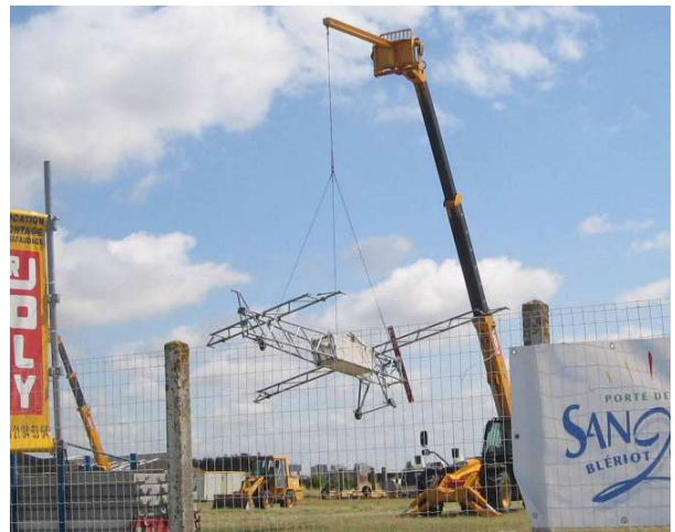
Le Blériot échafaudage