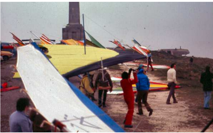
Déjà les embouteillages !