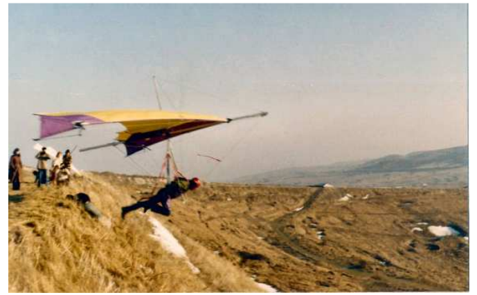
Déco sud du Blanc-Nez