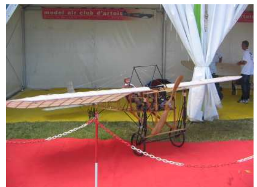
Le ½ Blériot