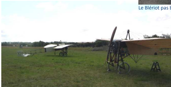
Le beau Blériot