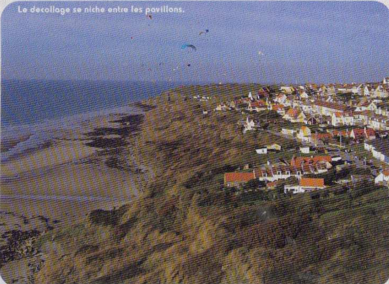
Le décollage se niche entre les pavillons.