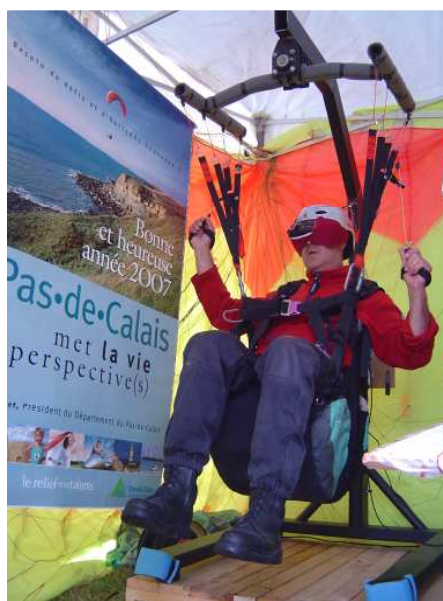
Inauguration du simulateur

Merci aux 28 membres du club qui se sont déplacés pour nous aider ou simplement nous rendre une petite visite.