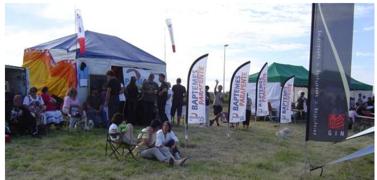
Le stand du club