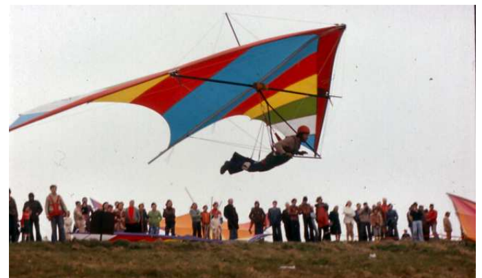
Force 5 à 6