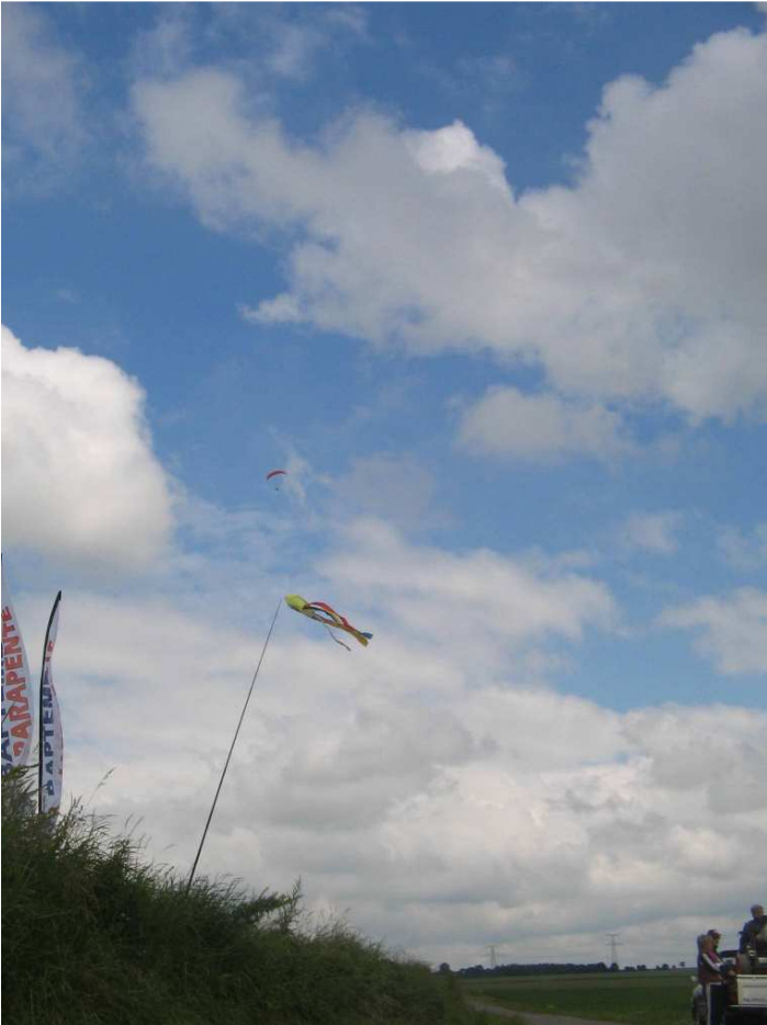
Y sont pas beaux ces cum !

PS : les Fils d'Ariane étaient là pour Wimereux s'envole sans les parapentes, pour l'intertreuil à Campagne lez Bouonnais et pour Blériot 2009 : ils se tapent l'incrust ces SDF !