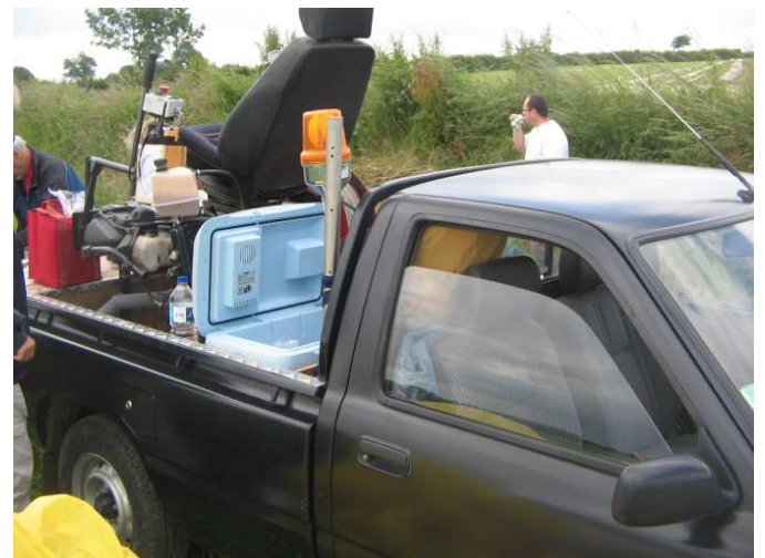
Le pick-up - treuil - bar ambulant avec frigo incorporé de Fil d'Ariane. A ce jour, ils ne nous ont toujours pas montré leur licence IV...