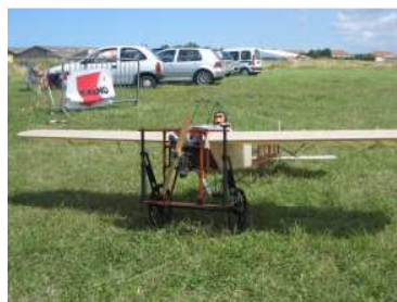
Le ¼ de Blériot