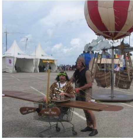
Le Blériot pas beau !