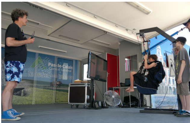
Le simulateur sur le car-podium du Conseil Général