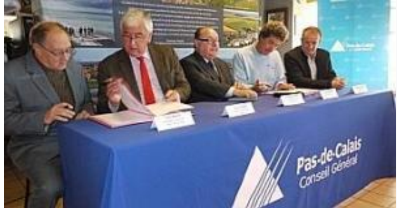
Le Cap Blanc-Nez est considéré par les amateurs comme le meilleur site de vol de pente du nord de l'Europe.