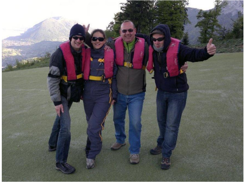
L'équipe du stage SIV