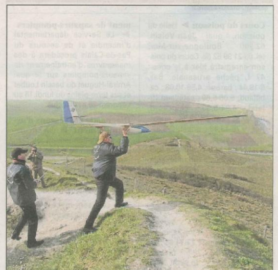
Les parapentistes, les aéromodélistes et les ornithologues ont signé une charte de bon usage sur le site du cap Blanc-Nez.

► Si ces activités vous intéressent, rendez-vous sur les sites paralaile62.free.fr et vdpblancnez.fr