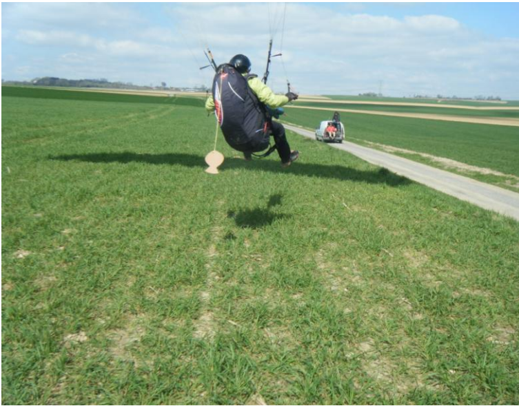
1 er avril à Campagne, Omar au décollage