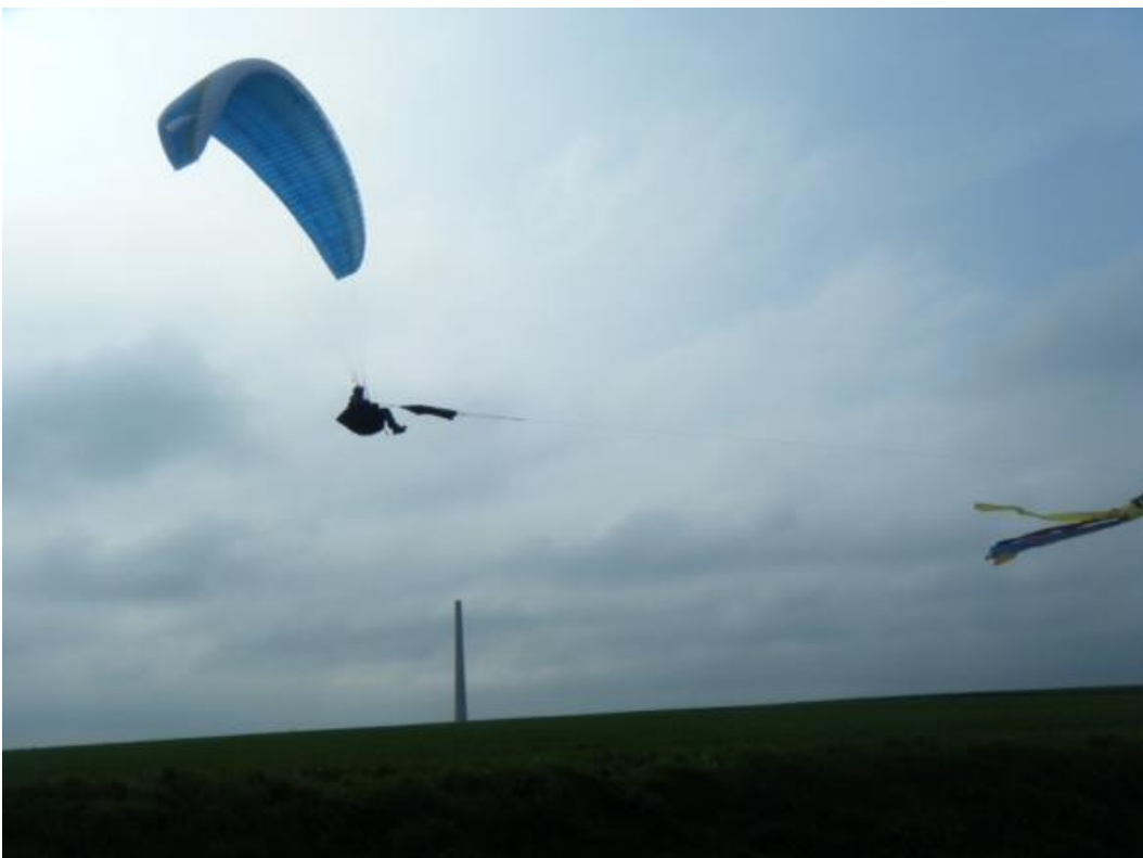
L'éolienne poursuit sa croissance