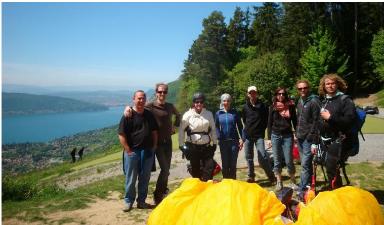
Au déco de Planfait