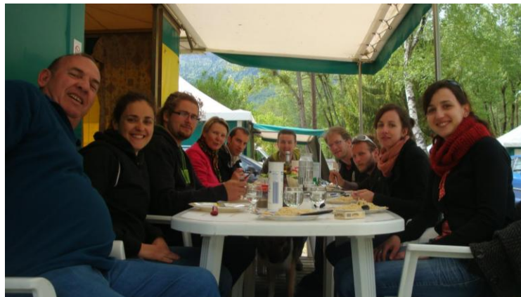
Camp de base à la Nublière