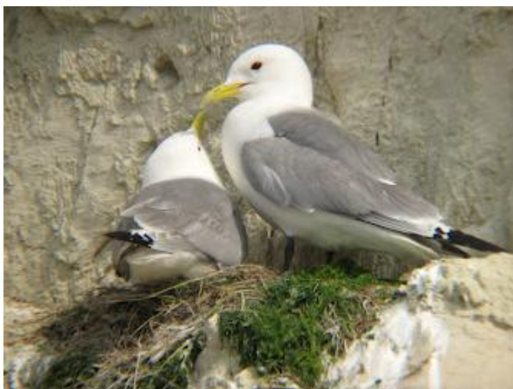
Couple de mouettes tridactyles, bec jaune et pointe des ailes noire