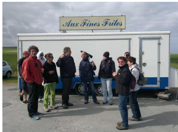
Le rendez-vous de la friterie...