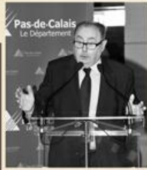
Dominique DUPILET Président du Conseil Général du Pas-de-Calais

✿ Lettre d'infos du Grand Site des Deux-Caps ✿