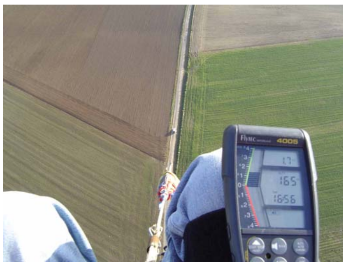
Treuil biplace, 30 octobre.