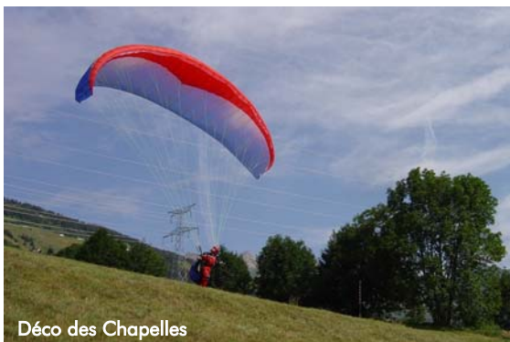
Déco des Chapelles