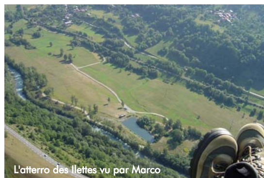
L'atterro des llettes vu par Marco

Un jour sans vol, nous avons reconnu le magnifique déco de Macot, sur la route de La Plagne, grand comme un terrain de foot, qui n'existait peut-être pas il y a 3 ans.