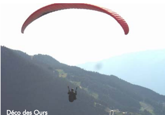
Déco des Ours

Nous avons rencontré deux écoles : Darentasia et Arcs-en-Ciel, à qui nous avons acheté un peu de matériel : très agréables et pas avares de conseils.