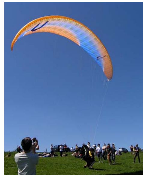
Ils l'ont vu ! le proto Aircross, futur U4, à la 2 ième manche (annulée !) de la compèt de Gérardmer, le 11 juin