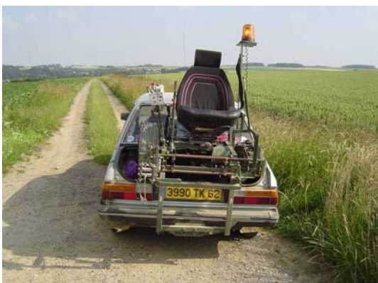
Le treuil dévidoir de Fil d'Ariane