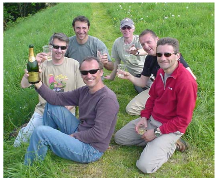
Champagne à la compèt de Clécy (Normandie)