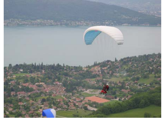
Vols biplace pour la fanfare