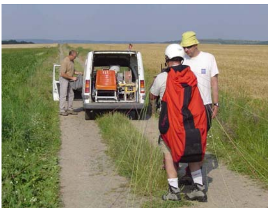
Décollage imminent avec le treuil dévidoir de Paral'Aile 62

http://perso.orange.fr/goailes/accueil_bis.htm