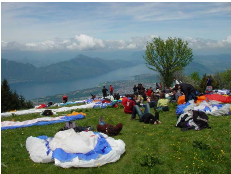
Déco du Sir Max