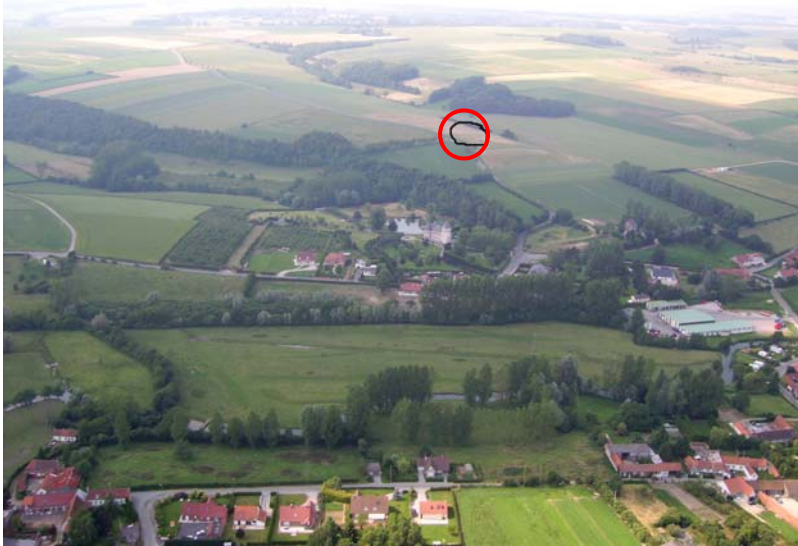
Atterrissage à Merck sur Liévin