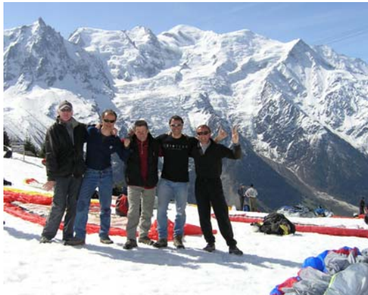
Le Team Paral'Aile 62 à la compèt de Chamonix du 1 er mai