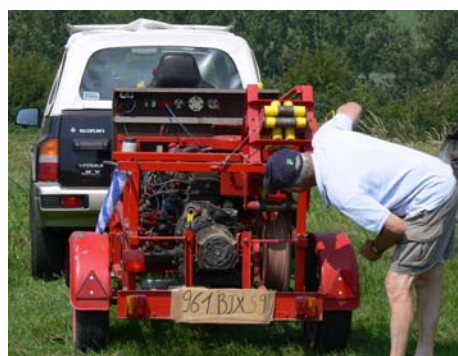
Le treuil de Raz'Motte